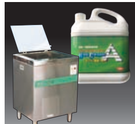
焼肉機器専用洗浄システム アライマン/ハイクリーナーA