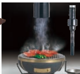
一般飲食店向け排煙システム ワンショットフード