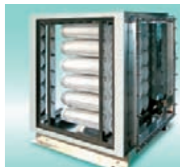
一般飲食店向け脱臭装置 脱臭くん